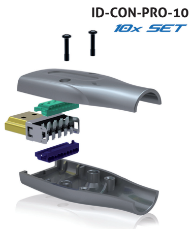
ID-CON-PRO-10 10x SET